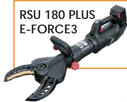
RSU 180 PLUS E-FORCE3