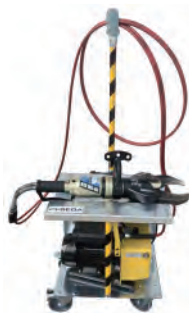
小型 移動推車 S-50422