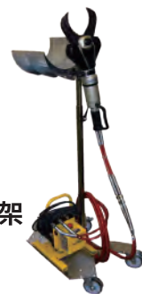
氣壓式 升降移動架 S-50336