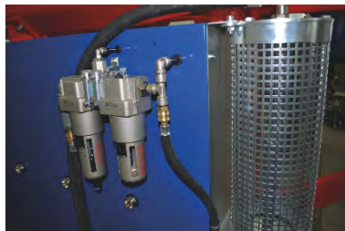
油料品質控制目測套件