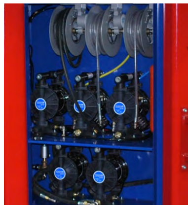
內建一體式泵浦系統